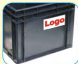
7804.931 Applicazione del logo o di eventuali altre scritte, senza limitazione di colori. Pellicola in plastica trasparente, saldata a caldo sulla cassetta. Risultato eccellente, duraturo, costo contenuto.