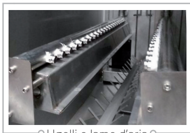
◦ Ugelli e lame d'aria ◦

I filtri meccanici assicurano la cattura dei residui di crema saldatore allungando la vita dei prodotti di lavaggio. Inoltre con appositi carrelli è possibile rimuovere i residui di fluxante dai PCB.